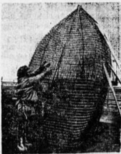
Зырянская верша для ловли рыбы.

* В Германии, в гор. Эмдене, отменены городские выборы, так как на все места были избраны коммунисты.