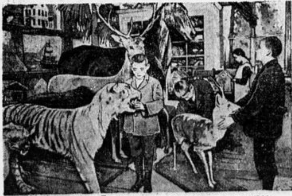
Слепые дети в Германии изучают зоологию в музее.