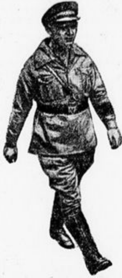
Гов. Тельман—председатель союза красных фронтовиков.

— Что это? Клуб Красной Пресни?! Этот огромный зал, весь сверху донизу убранный плакатами и знаменами?