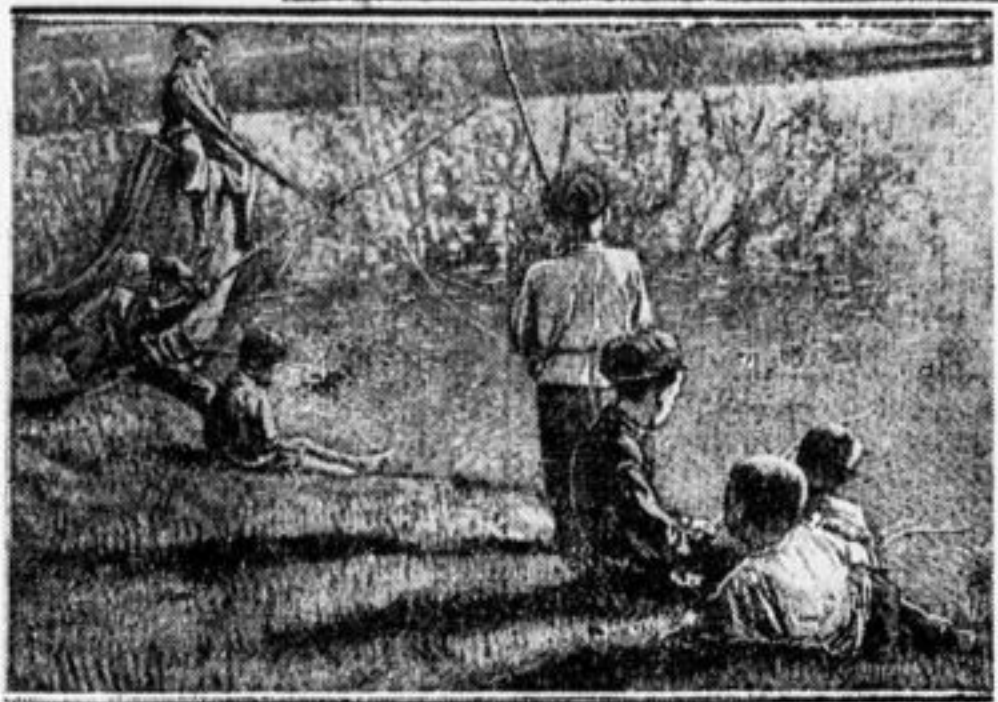
Рыболовы на окраине.